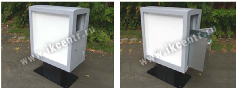
Рекламные урны с внутренней светодиодной подсветкой

Стоимость рекламных урн РУ-1, РУ-2, РУ-3 и РУ-4 с внутренней двусторонней светодиодной подсветкой рекламы уточняется индивидуально, по запросу.